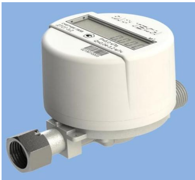
Рисунок 1 - Общий вид счетчиков газа бытовых ДТСГ

Фотография внешнего вида счётчиков газа бытовых ДТСГ приведена на рисунке 1.